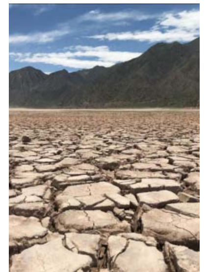
en San Pedro Lagunillas y otro en La Yesca.

Daños en 303 hectáreas han dejado 4 incendios forestales en Nayarit durante la presente temporada, informó la Comisión Nacional Forestal. En el recuento aún no se incluyen dos incendios que hasta el lunes estaban activos en Nayarit: uno