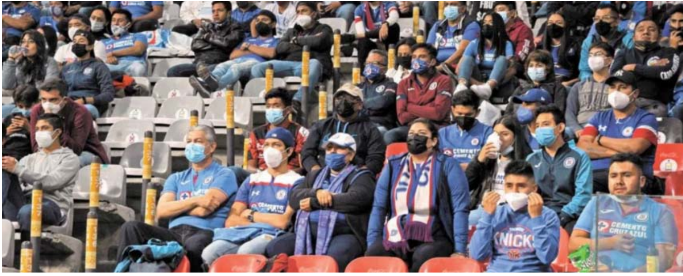
En los estadios: INAI