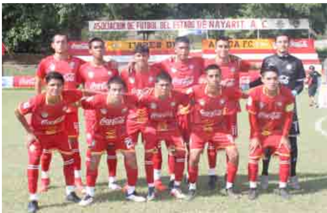
Tigres de Álica están en 5º lugar en la tabla.