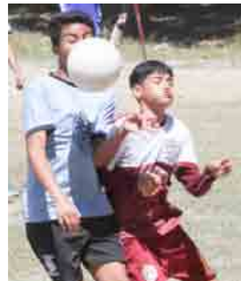
Dura la pelea en media cancha, metiendo el hombro para tratar de quedarse con el balón.