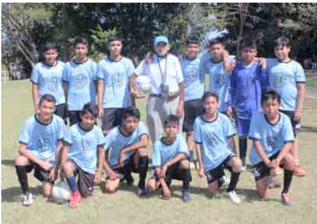
El Deportivo Tierra y Libertad empató a duras penas 3-3 con Bonaterra