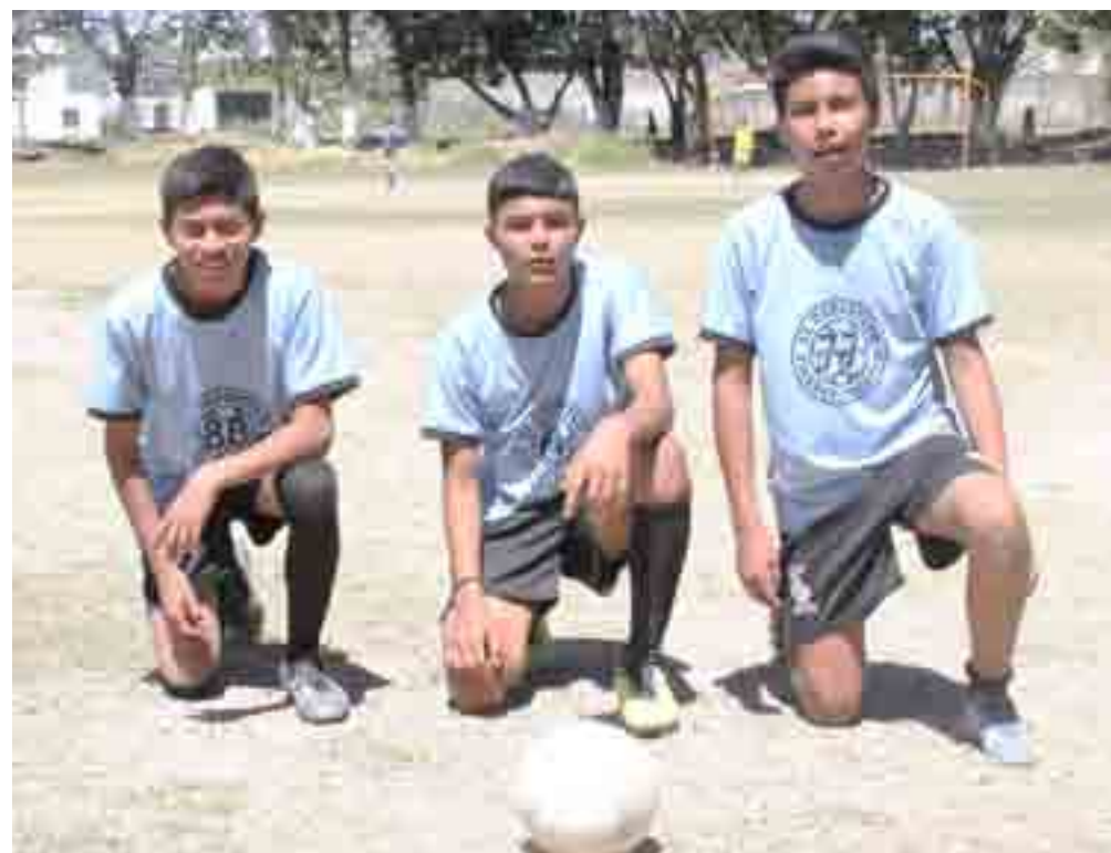
Los tres mosqueteros, los tres anotadores de El Deportivo Tierra y Libertad