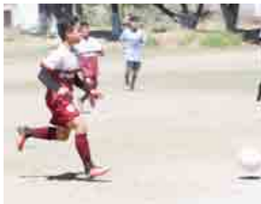
Bonaterra siempre fue arriba en el marcador, al final el Deportivo Tierra y Libertad les arrebataron un punto

Previamente, el Deportivo Tierra y Libertad, en parvulitos empataron a un gol contra 2 de Agosto.