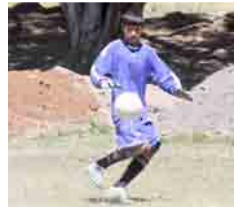
El guardameta de Tierra y Libertad tiene condiciones para ser futbolista profesional, nomás que se zafe de los pránganas que hacen daño.