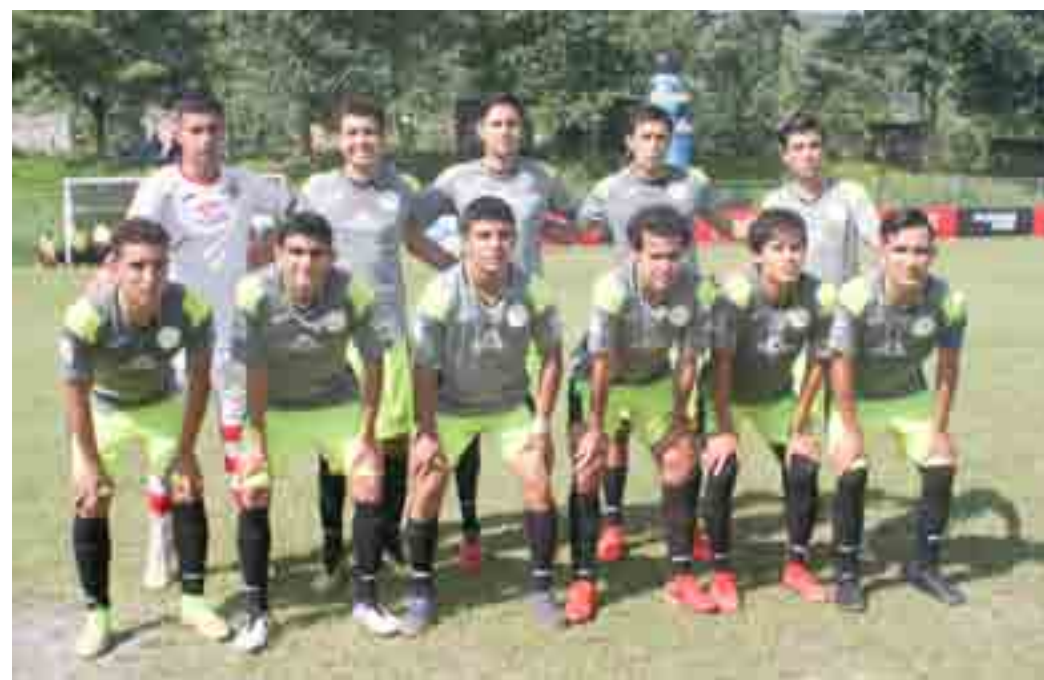
Diablos de Tesistan son los que mandan en el Grupo 14 de la TDP