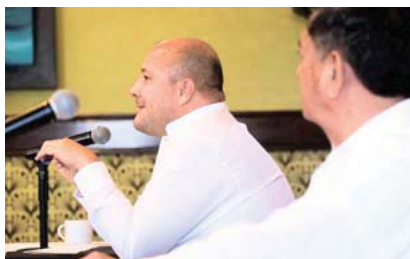
Sostiene el gobernador Enrique Alfaro Ramírez

"Han modificado la norma para que ya no tenga competencia el Tribunal en el control de la regularidad legal y constitucional de actos de Congreso. Eso no es de genuinos demócratas", dijo el consejero.