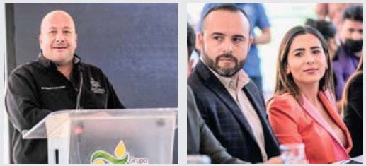
Inauguran segunda línea de la planta de alimentos para mascotas de Grupo SESAJAL

Por otra parte el Gobernador anunció la infraestructura deportiva que se realizará la cual incluirá una alberca pública, una cancha multiusos, gimnasio, pista para caminar y hacer ejercicio con una inversión inicial de 30 millones de pesos.