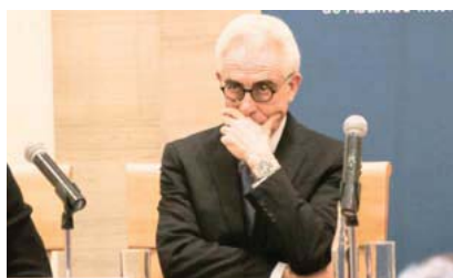
Foro virtual "Perspectivas económicas y el futuro de la tecnología en AI"

cuantos, en deuda pública con el Fobaproa, una deuda de tres billones de pesos, la deuda de los banqueros y de algunos empresarios, lo convirtió en deuda de todo el pueblo de México", indicó. López Obrador afirmó que en la gestión de Zedillo no se logró nada bueno para México, mientras cuestionó: "¿Qué otra cosa hizo? No voy a hablar de Acteal o de la represión en las comunidades indígenas" y añadió que Zedillo fue el que privatizó los ferrocarriles nacionales, el que acabó con los trenes de pasajeros, toda la historia del ferrocarril la derrumbó. Desde el primer ferrocarril que hubo en México y acusó que privatizó dos empresas y luego de eso, "tuvo el descaro de que cuando terminó su gobierno se fue a una de esas empresas", reprochó. Este viernes se publicó que el ex presidente de México y catedrático de Yale, Ernesto Zedillo, afirmó que la región de Latinoamérica sufre de gobernantes populistas e ineptos, los cuales en algunos casos han obstaculizado el crecimiento o desarrollo social y económico. Al participar en el foro virtual "Perspectivas económicas y el futuro de la tecnología en Latinoamérica", organizado por la consultora NTT Data, Zedillo aseguró que las brechas que atorán el desarrollo, y que también empeoraron a causa del Covid-19, podrán subsanarse con estrategias y políticas debidamente consensuadas en las sociedades.