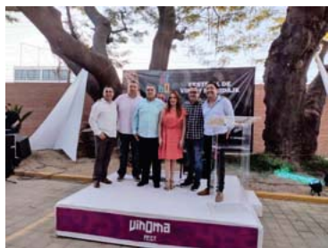
El evento se extenderá hasta el domingo 20