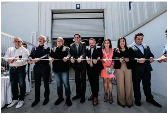
Impulsar desarrollo integral de niñez, objetivo