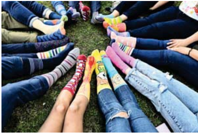
Prepara DIF Jalisco a niñez con Síndrome de Down con oportunidades de desarrollo