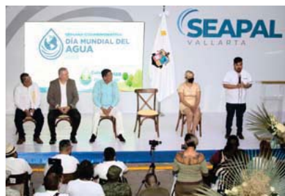
Sistema de Agua Potable, Drenaje y Alcantarillado

En agosto de 2021 se inició a nivel internacional y nacional la reactivación gradual de los cruceros, incluyendo Puerto Vallarta. Durante ese año los arribos sumaron un total de 61, con 102 mil 306 pasajeros.