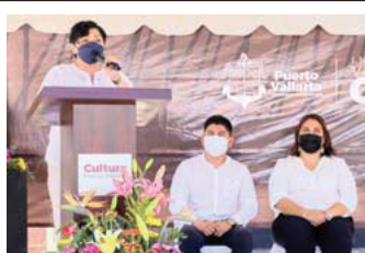
Pueblos originarios, evento organizado por el Instituto Vallartense de Cultura