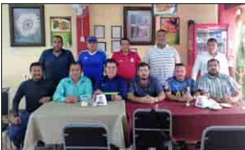
Se llevó a cabo la reunión para perfilar acuerdos y programa de actividades para el 1° de Mayo en el Día del Árbitro

Desde el año 2014 que se inauguró, la pista sintética del estadio olímpico Santa Teresita no había recibido mantenimiento correctivo, siendo urgente estas acciones para preservar y mejorar las condiciones de entrenamiento y competencia de nuestros atletas, con esto, beneficiar a más de un millar de deportistas de distintos clubes que entrenan todos los días en esas instalaciones.