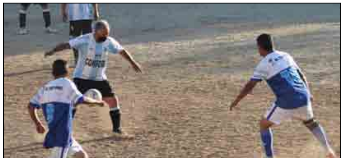
Muy parejos, de poder a poder buscaron lo 3 puntos.