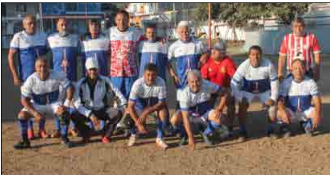
Lázaro Cárdenas tiene 13 puntos y Real Provincia permanece en la cima con 20, "la fuerza azul" sigue siendo enemigo de mucho cuidado.