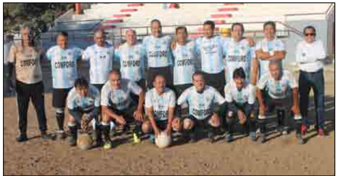
Definitivamente el estado físico de la "la caminera" mermó el accionar de los jugadores de velocidad, Real Provincia no pudo.