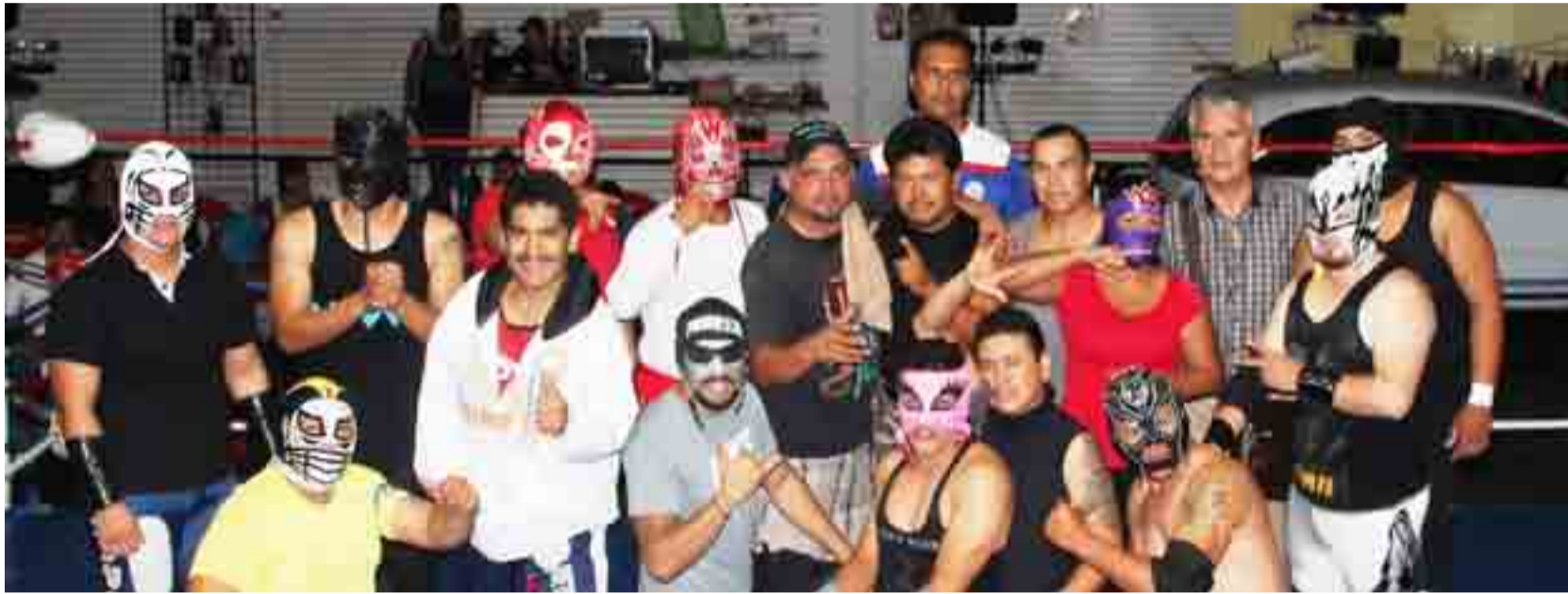
Dicen que a “la bestia” el que lo halle es de él ¿para qué?, en la foto el grupo de luchadores que levantan cualquier función.

¿qué fregados estaba pasando? Simplemente que el campeón, sí, el presumido “la bestia”, no sabemos el motivo, pero simplemente NO SE PRESENTÓ. Hubo que ponerle al Silver otro contrincante para sacar la función, pero eso del campeonato quedó en el aire, esperamos que el comisionado, lic. Tomás Muñoz, haya tomado nota para que se actúe en consecuencia, así las cosas. La temporada ha quedado suspendida por las fechas conmemorativas en esta llamada “semana mayor”, las acciones, esperamos, se reanuden a la brevedad, ¡Vaya Pues! Cosas veredes mío cid.