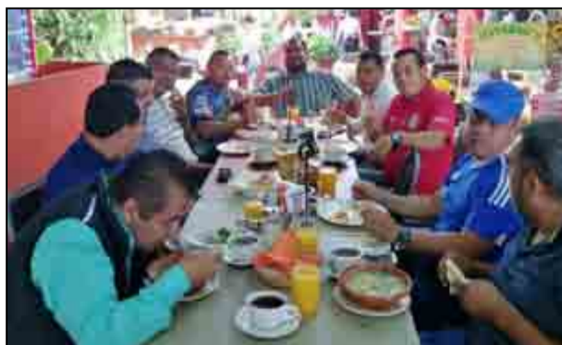
Después del conclave, justo es compartir los Sagrados Alimentos en sana convivencia

Delegación Estatal de Arbitraje Sector Amateur Nayarit