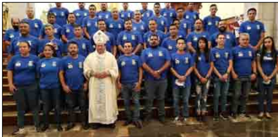
El 1ro. De mayo celebrarán su día los árbitros, tiempo es de valorar la importancia de su humano trabajo.

Ya para acabarse el tiempo de juego, ponchillo controla, el defensa se le va tratando de anular el tiro, rápido poncho se la da a toto, otro contrario trata de despojarlo con fuerza, normal, toto en un reflejo de rapidez mental se la regresa a ponchillo y este la