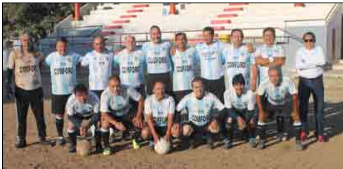
Estupendo triunfo para Real Provincia ante Spauan, los albicelestes venían de perder con Lázaro Cárdenas.

Con lo ya mencionado, resaltó la importancia de trabajar en equipo y hago el reconocimiento a nuestras y nuestros entrenadores y padres de familia, que sin duda son parte de esta nueva era del deporte en nuestro estado. ¡Nayarit despierta en el deporte!