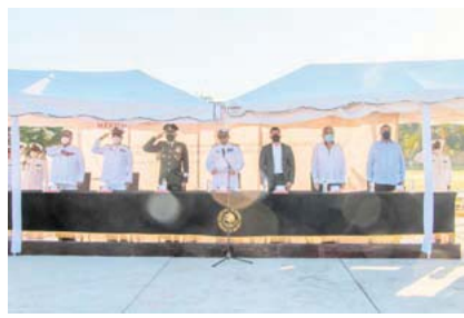
Autoridades civiles y militares