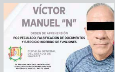
Se le acusa de peculado