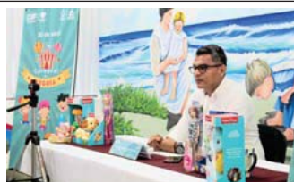
Este 30 de abril