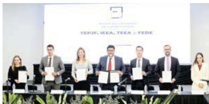
El TEPJF con autoridades electorales de Aguascalientes