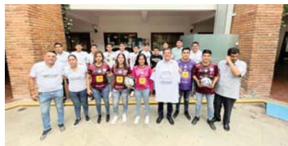
En la rama varonil