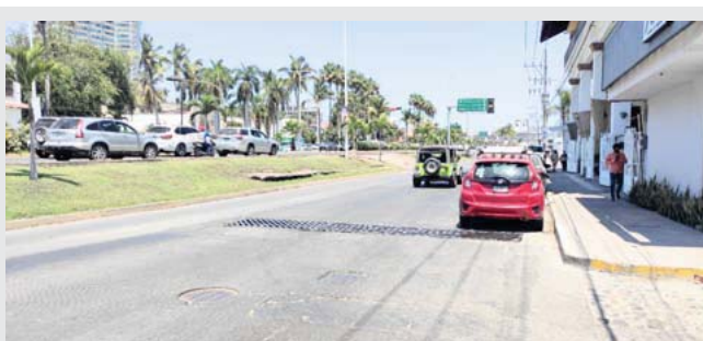
A partir del próximo lunes 25