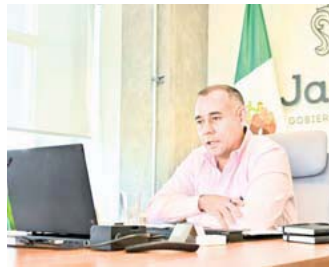
A favor de la infancia