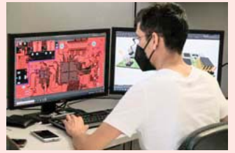
Posicionado como el primer lugar a nivel nacional en solicitudes de patentes en 2021