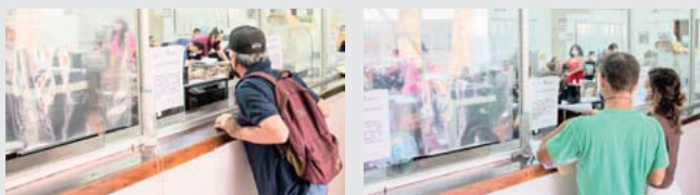
Puerto Vallarta cumple exhorto del Congreso Estatal

Pidió la comprensión de los ciudadanos, pues si bien estas obras estarán generando carga vehicular durante algunas semanas, una vez concluidas, permitirán que las familias de Las Juntas puedan vivir tranquilas sin el riesgo de perder o ver dañado su patrimonio por las inundaciones que provocan la falta de infraestructura adecuada.