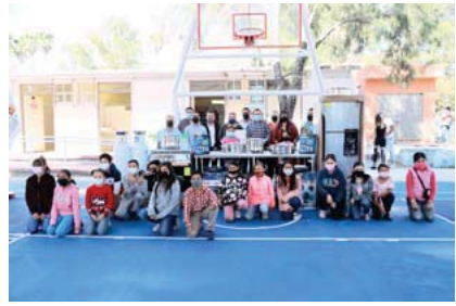
En esta ocasión en la comunidad de Ixtlahuacán de los Membrillos

Desde los primeros semestre del plan de estudios de la Licenciatura en Abogado de la Universidad de Guadalajara se contempla la materia de derechos humanos y estudio de casos colectivos y con perspectiva de género en que la Corte Interamericana de Derechos Humanos se ha pronunciado y ha hecho observaciones el Gobierno mexicano.