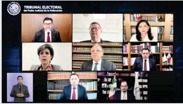
La Sala Superior emitió el cómputo final y lo declaró concluido