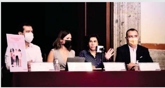
Secretaría del Transporte de Jalisco