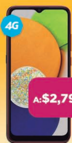
SAMSUNG Galaxy A03

Encuétralos también en www.telcel.com/tienda