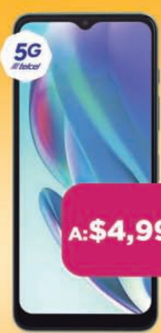
MOTOROLA g50 5G