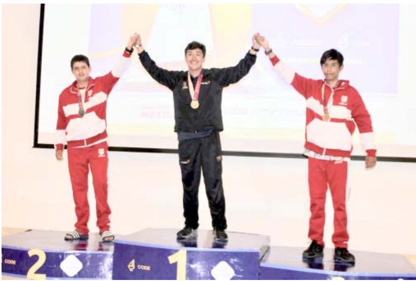
En los Juegos Nacionales Conade