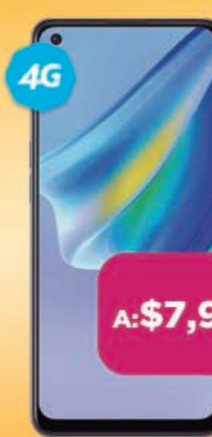
OPPO Reno 6 Lite