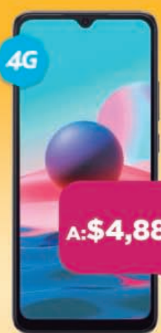
XIAOMI Redmi 10 C