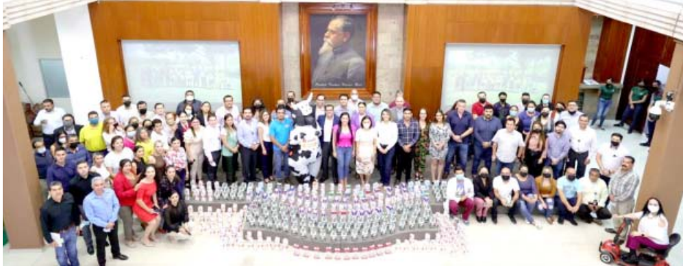
Alcanzan 532 litros de leche para el Banco de Alimentos