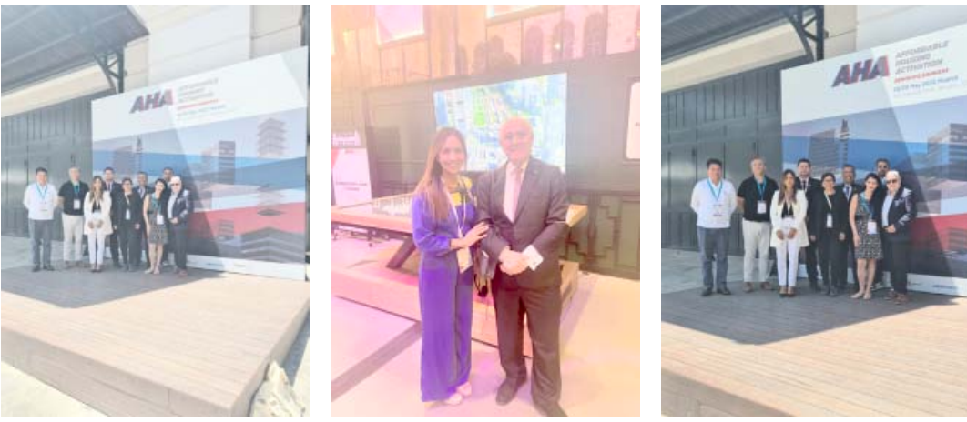
Participa en Foro Europeo