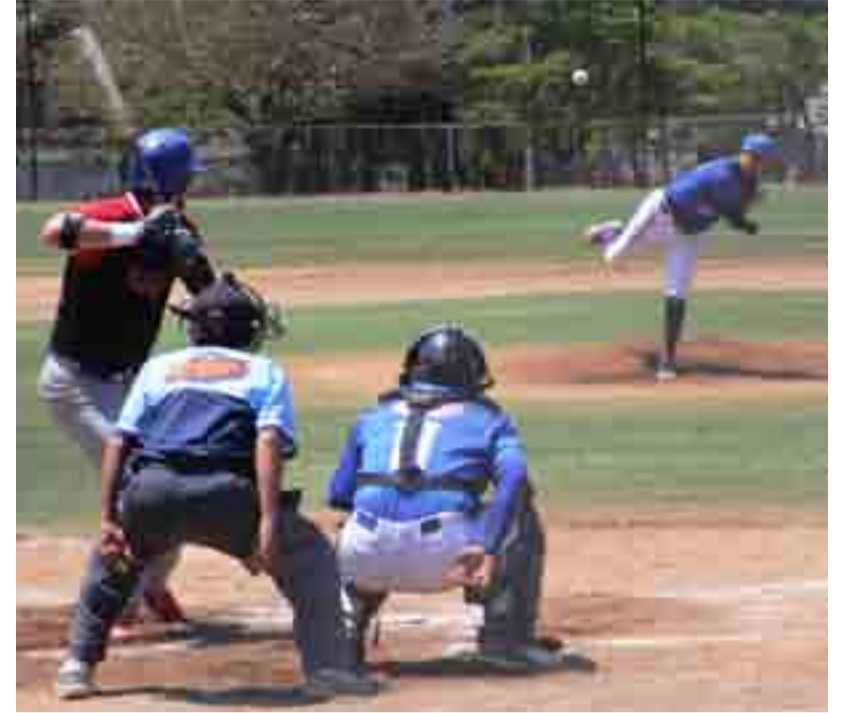
La fiesta en el rey de los deportes