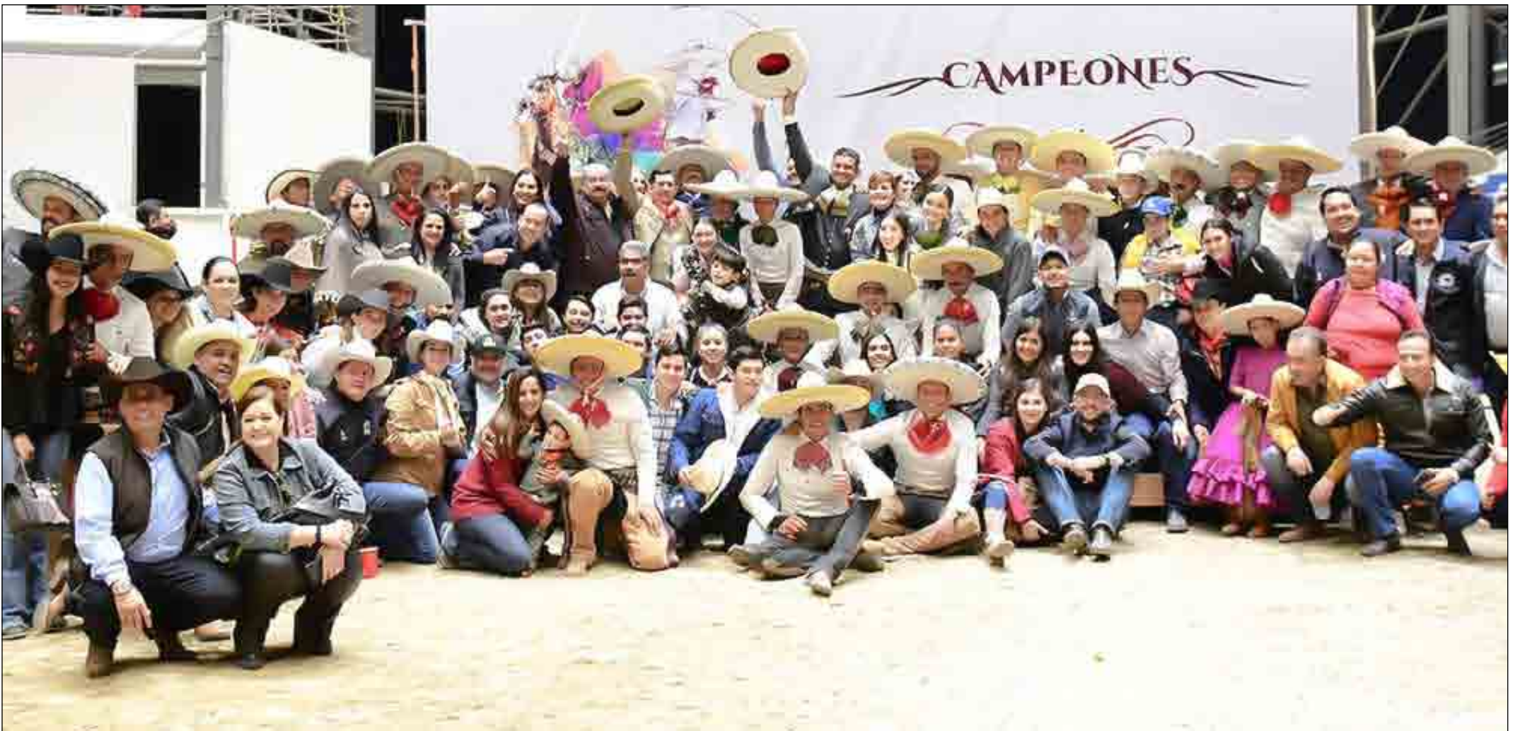
Rancho "El Quevedeño" mostrando su jerarquía del campeonato Nacional que obtuvo el 21 de noviembre del 2021.