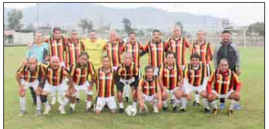
Provincia pondrá a prueba la costumbre que tiene Batemeta