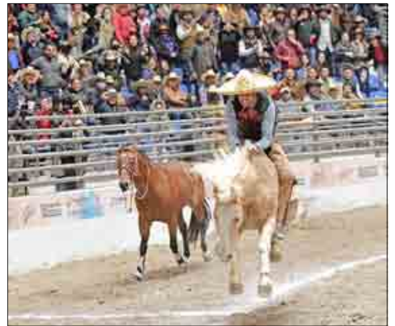
Los campeones nacionales, los Charros de Rancho "El Quevedeño" lograron 393 puntos en Morelia.

ENVIAR COMENTARIOS A: charrocasama@gmail.com