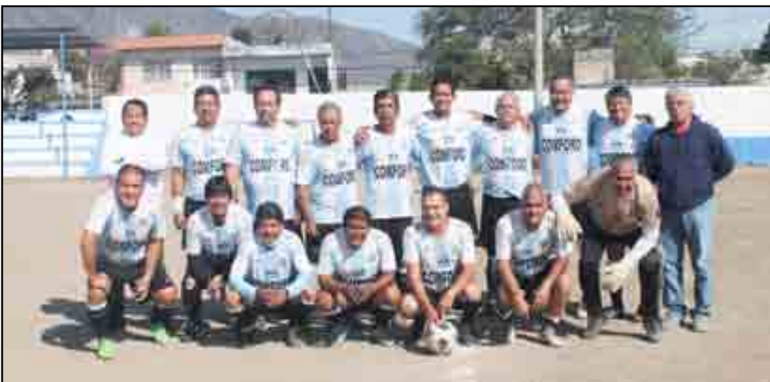
Dos titanes frente a frente, Provincia y Batemeta

Solari se formó en las inferiores de Talleres de Córdoba. En 2020 llegó a Colo Colo, que compró el 80% de su pase en una cifra cercana a 1,5 millones de dólares.