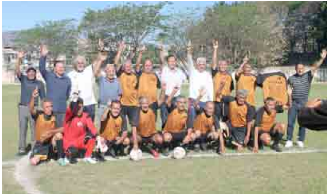
Por otro trofeo de campeón el cuadro Zapata

Diamante "B", semifinal de copa a un solo partido, Real Prvincia recibirá a Quinta Zapote a las 07:45