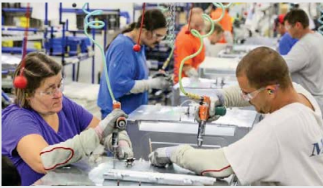
Con 38 mil 233 puestos de trabajo formal acumulados en el año