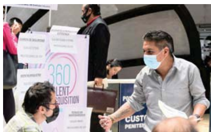
Reportó el Instituto Mexicano del Seguro Social