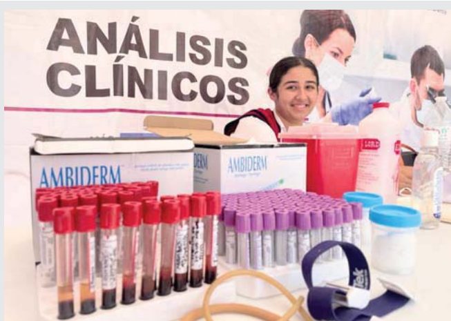
Celebrada en el poblado de Bucerías