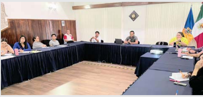
Dirección de Desarrollo Institucional