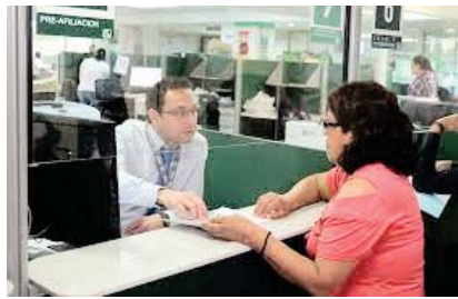
Inicia una nueva semana con avance frente al billete verde

Asimismo, pese a la pérdida de plazas el Instituto registró dos mil 199 patrones nuevos en mayo, con lo que tuvo registro de un millón 61 mil 454 empresas al cierre del quinto mes del año, un incremento de 5.5 por ciento respecto al mismo periodo de 2021.