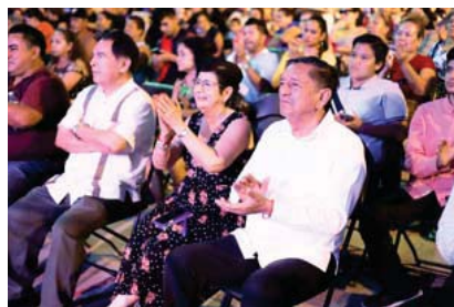
Festejo masivo en Puerto Vallarta

Confirmó que "hay un gobierno cercano a la gente, con un presidente de la república que se preocupa por el pueblo de México, porque para él primero es el pueblo de México y después también el pueblo de México. Un gran aplauso para Andrés Manuel López Obrador, aquí hay un gobierno que le sirve al pueblo de Puerto Vallarta, eso necesitamos que suceda también en Jalisco".