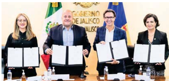
Para atención de cáncer infantil

También invitó a los empresarios a ser parte de este esfuerzo en favor de los jóvenes.