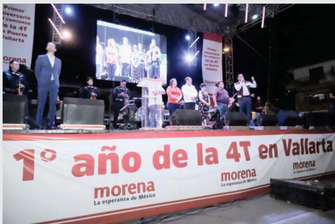
Gran concentración de morenistas en El Pitillal abarrotaron la plaza