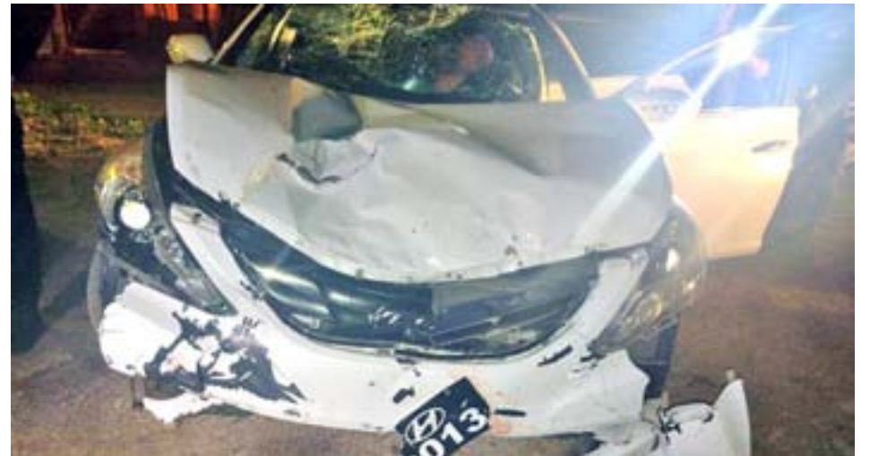
Tras brutal embestida a motociclista