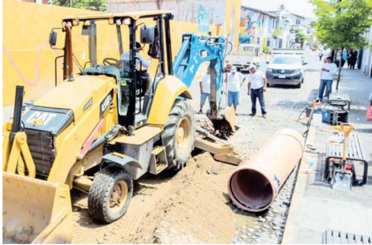
De manera oportuna, para evitar mayores afectaciones