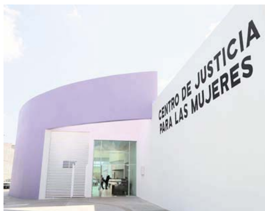
Quedan a deber a las víctimas