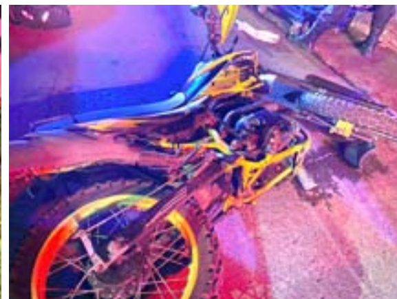
Motociclista lo atropelló