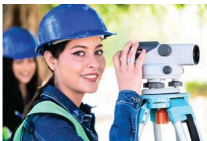
Gobierno estatal anuncia nuevo programa económico que genere empleos de calidad

El evento México Carbón Forum 2022, es organizado por MéxicoCO2 en colaboración con la Secretaría de Medio Ambiente y Desarrollo Territorial (Semadet) y la Secretaría de Desarrollo Económico (Sedeco), con apoyo del Tecnológico de Estudios Superiores de Monterrey, Campus Guadalajara. La agenda completa del evento puede consultarse en: https://www.mexicocarbon.com/