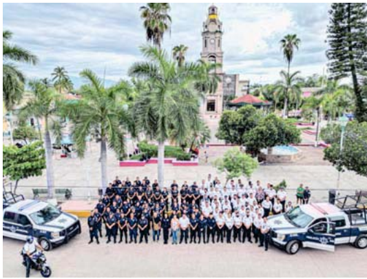
Cumple la presidenta el compromiso de reforzar la seguridad de los bahiaberenses