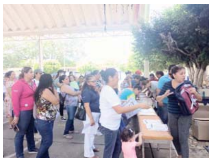
A casi 17 mil alumnos del presente ciclo escolar 2022-2023

El lunes pasado empezaron los trabajos del congreso en su primera etapa, la cual se desarrolló en la capital del estado, en la sede de Ciudad Judicial.