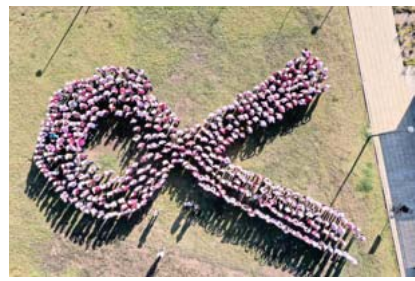
SSAS y DIF Jalisco

Las empresas apoyadas por la SEDECO son Just About Foods; Huevo Y Chía Navarro; Preventy Organics; Old School Spirits; Naturkost De México; Aceitera Mevi; Productos UvaViña; Trigave Comercial; Tequila San Matias y Abeja Reyna.