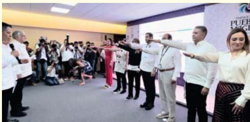
Reconocimiento a trabajo de Nayarit