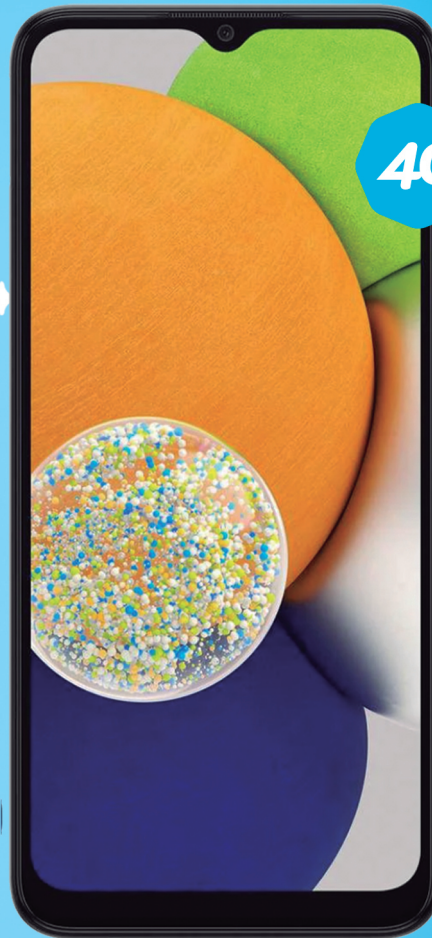
SAMSUNG Galaxy A03