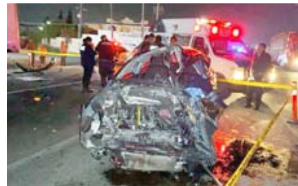
Destrozó se lujoso automóvil