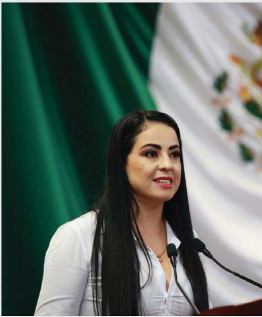
Primer Informe de Gobierno de Nayarit