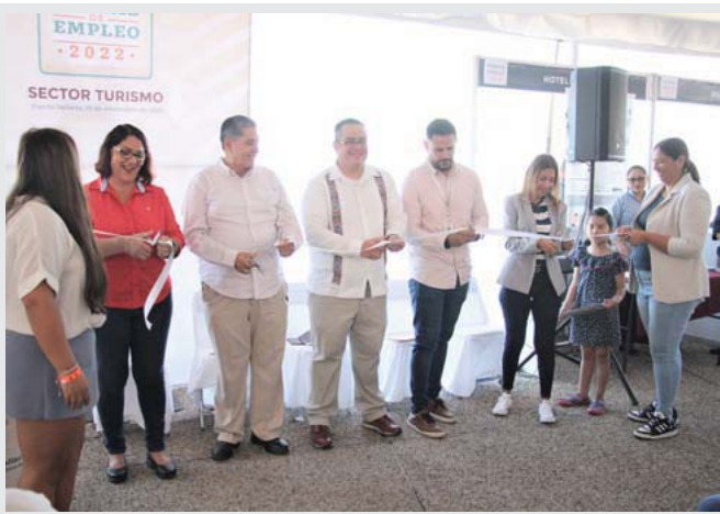
En el parque 'Lázaro Cárdenas'