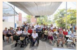
Esto como resultado de la confianza del sector privado en las instituciones municipales