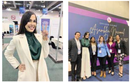
En AALMAC y CONASyR

Esto no es nuevo, pues a lo largo de décadas Puerto Vallarta ha conquistado otros galardones de firmas como PriceTravel, Conde Nast Traveler, Travel&Leisure, FamilyTravelForum, Apple Vacations, el FishingBooker especializado en la pesca deportiva, Canadian Garden Tourism Awards, y muchas más.