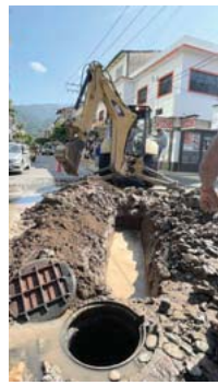
Con obras provisionales para evitar encharcamientos en calles Insurgentes y Madero