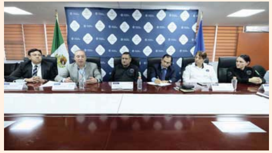
Secretaría de Seguridad del Estado de Jalisco