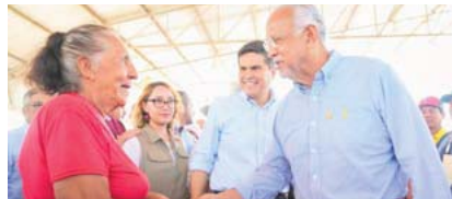
En conjunto el gobierno de Nayarit y la Federación