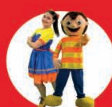
Tributo Bely y Beto "Navideño" 04 Diciembre