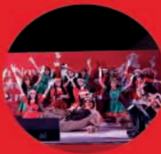
Pastorela 10 Diciembre