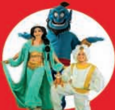
Show Case Aladdin 21 Diciembre