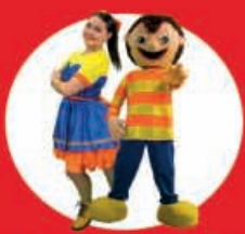
Tributo Bely y Beto "Navideño" 01 Diciembre

Te esperamos a las 18:00 hrs en tu show favorito