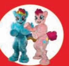
Show Case Little Pony 17 Diciembre