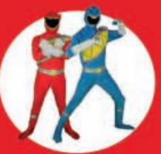
Show Case Power Ranger 16 Diciembre