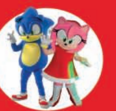
Show Case Sonic & Amy 23 Diciembre

Av. Insurgentes 1100, a un costado de Plaza Álica