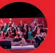
Pastorela 18 Diciembre