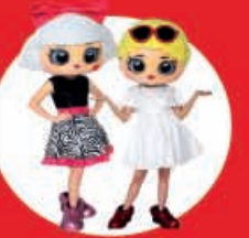
Show Case LOL Surprise 11 Diciembre