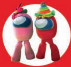
Show Case Among Us 19 Diciembre