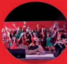
Pastorela 03 Diciembre