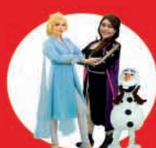
Show Case FROZEN 09 Diciembre