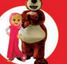
Show Case Masha y el Oso 22 Diciembre