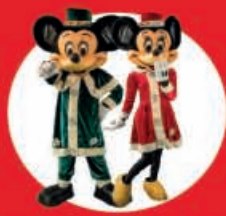
Show Case Infantil Mickey & Minnie 02 Diciembre