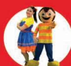
Tributo Bely y Beto "Navideño" 04 Diciembre