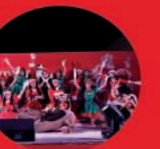
Pastorela 18 Diciembre