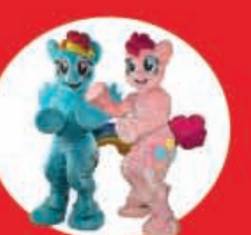
Show Case Little Pony 17 Diciembre