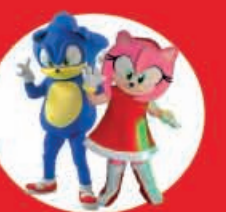
Show Case Sonic & Amy 23 Diciembre

Av. Insurgentes 1100, a un costado de Plaza Álica