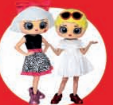
Show Case LOL Surprise 11 Diciembre