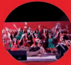
Pastorela 03 Diciembre