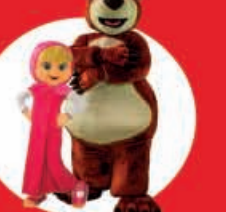
Show Case Masha y el Oso 22 Diciembre