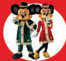
Show Case Infantil Mickey & Minnie 02 Diciembre