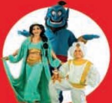
Show Case Aladdin 21 Diciembre