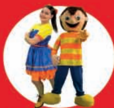
Tributo Bely y Beto "Navideño" 01 Diciembre

Te esperamos a las 18:00 hrs en tu show favorito