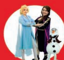
Show Case FROZEN 09 Diciembre