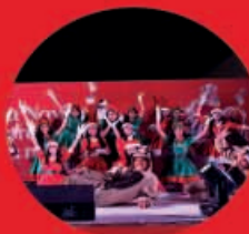
Pastorela 10 Diciembre