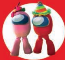
Show Case Among Us 19 Diciembre