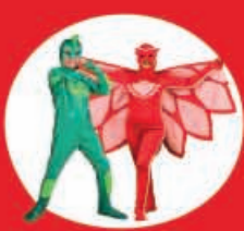
Show Case Pj Mask 20 Diciembre