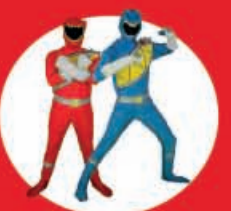
Show Case Power Ranger 16 Diciembre