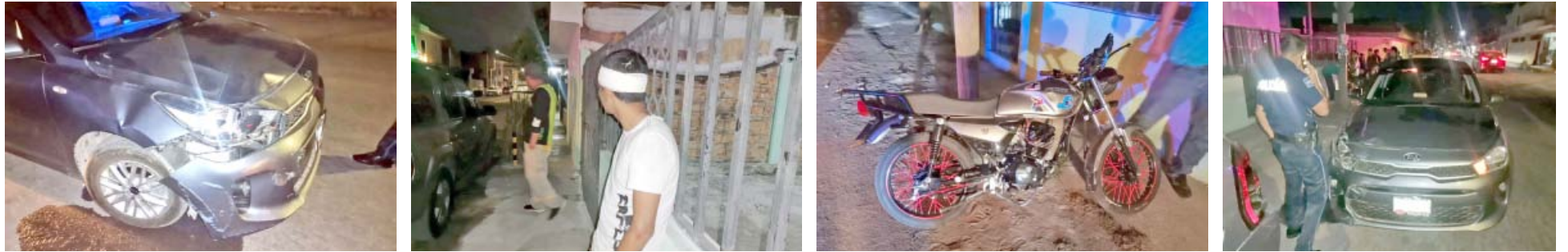
No respetaron el uno y uno