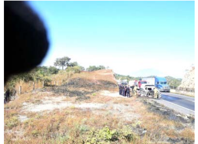
En la caseta de SAMAO