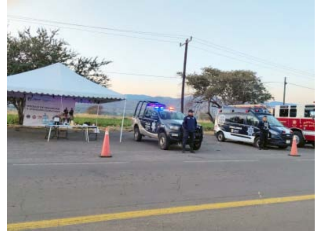
En carreteras nayaritas