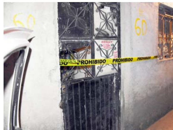
Encuentran a pareja sin vida