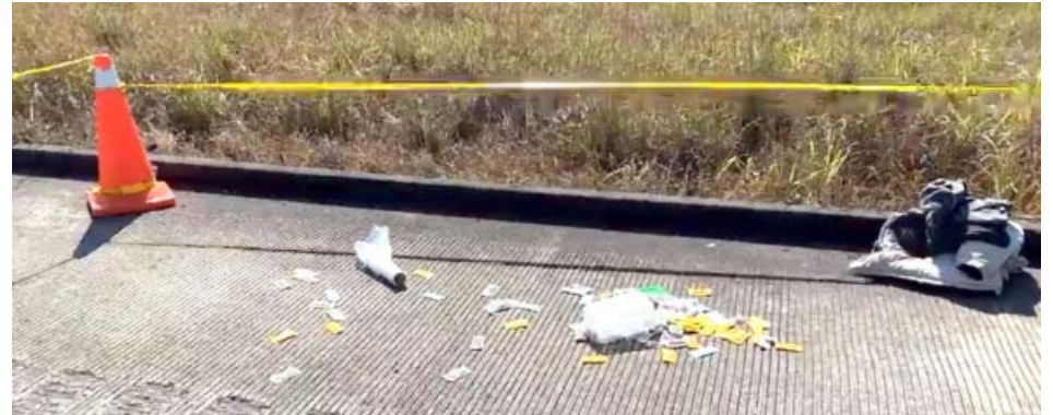
En la Tepic-Guadalajara