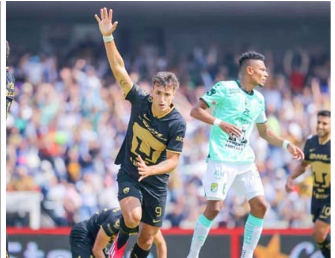
Tabla general de la Liga MX: Clausura 2023, Jornada 3

Los Tigres son los líderes del torneo, aunque la diferencia de puntos con sus principales perseguidores es mínima.