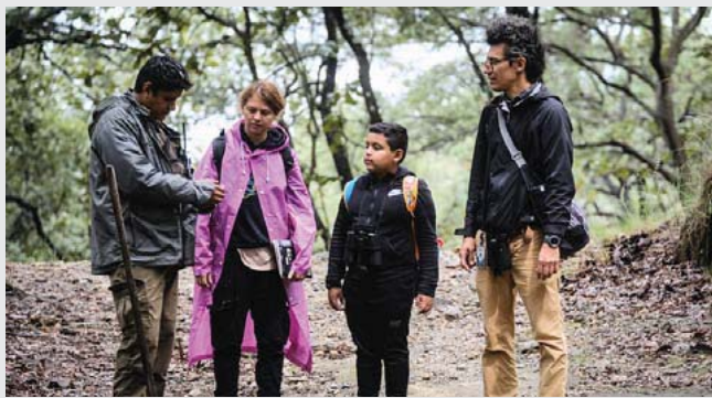
Cierra con un programa especial de Frecuencia Ambiental a través de Jalisco Radio