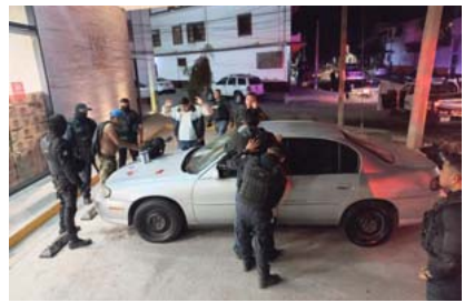
Patrullaje permanente para inhibir delincuencia