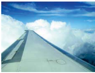
Así es el avión creado por Boeing y la NASA