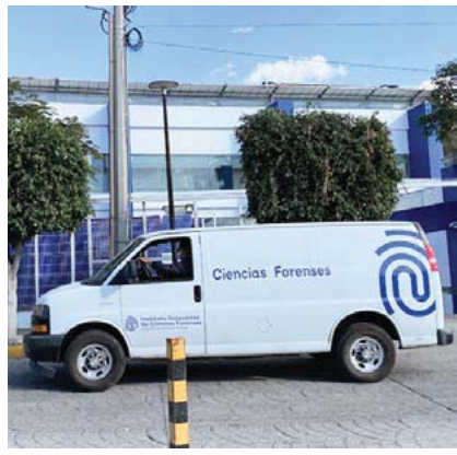
A familiares de personas desaparecidas en la región Altos Norte