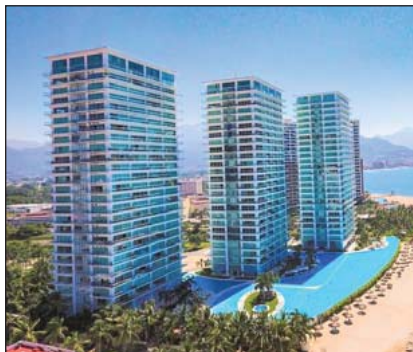
El boom inmobiliario en Vallarta.

Aquí somos expertos en vender tierra, pero somos incapaces de desprendernos de un solo centímetro cuadrado en beneficio de las vías y carreteras. En pocas palabras, tenemos lo mismo, pero vivimos más apenuscados.