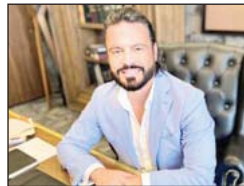
Aristóteles Sandoval de Jalisco y... ¿quién se acuerda de él? solo su familia

narco tráfico se siente en cada paso que das hacia aquel rumbo. Y es que ahora el narco y se metió a los negocios lícitos porque saben que el crimen no paga y si deja jugosas ganancias en lo legal.