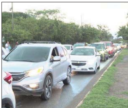
Tráfico imposible de avanzar.