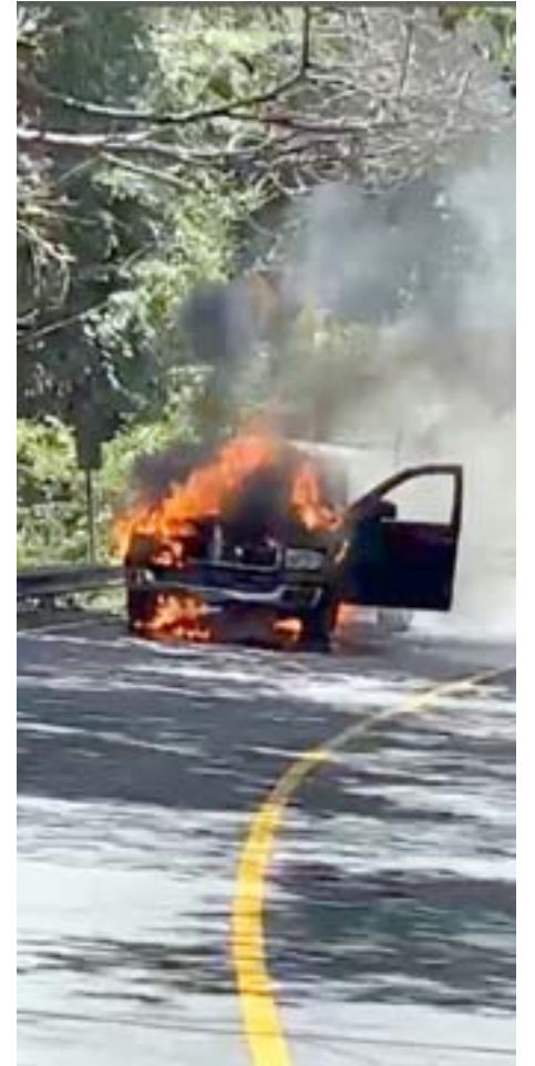
En la Tepic- Puerto Vallarta