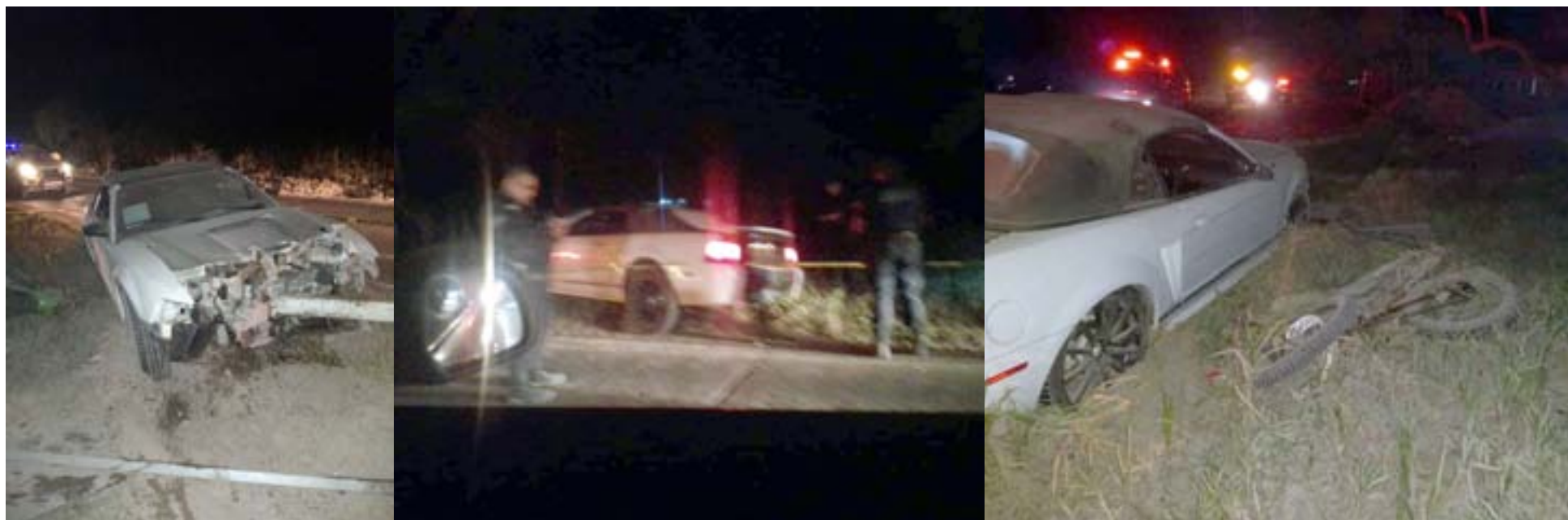
Joven motociclista perdió la vida