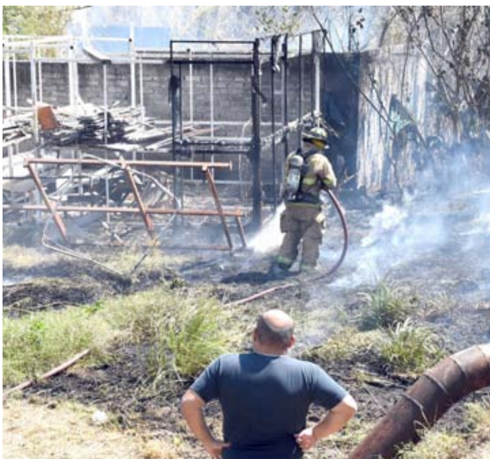
Se achicharraron tubos de PVC