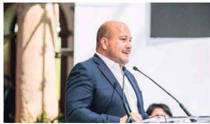
jefe del Ejecutivo estatal. "Ánimo Gobernador".

Por su parte, el alcalde de Guadalajara deseó vía sus redes sociales "pronta recuperación al