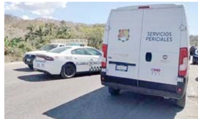
La hallaron muerta entre la maleza