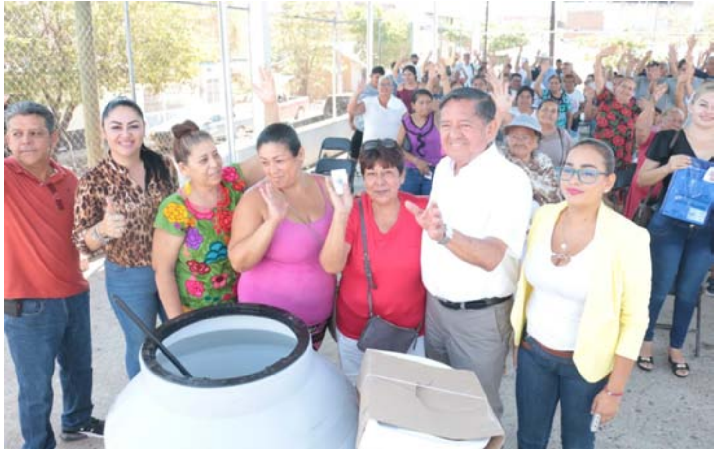
En beneficio de más de 60 familias de esta demarcación