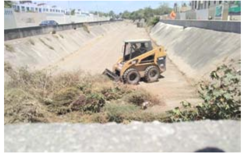
Servicios Públicos, programa y como medida preventiva

De acuerdo con información de la dirección de Desarrollo Social del Ayuntamiento, en esta primera etapa del programa “Por un Hogar de 10”, se pretende beneficiar a más de 2 mil 200 familias del municipio, con la entrega de materiales, como tinacos, pintura y juegos de baño.