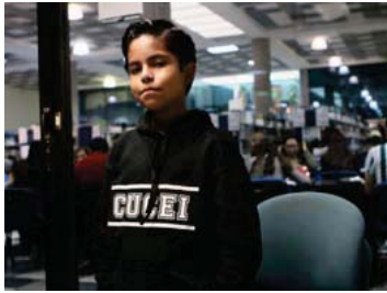
El niño genio, de 13 años, biólogo molecular más joven del mundo