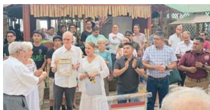
Del artista James Demetro

El festival concluirá el 01 de julio, con una misa de acción de gracias amenizada por el Mariachi Nuevo Tecalitlán, en la parroquia de Guadalupe, a las 12:00 horas.