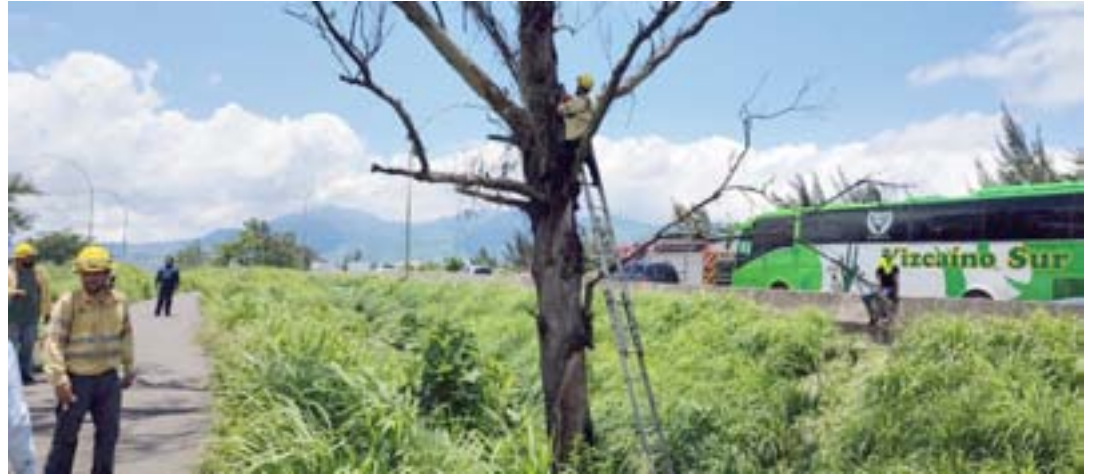
Con tala de árboles