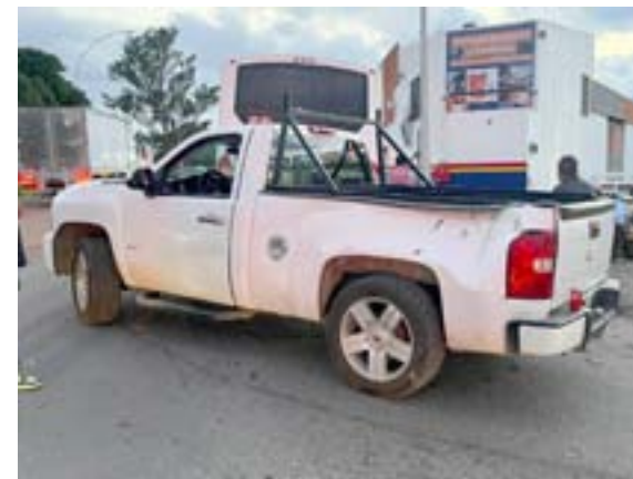
En el libramiento de Tepic