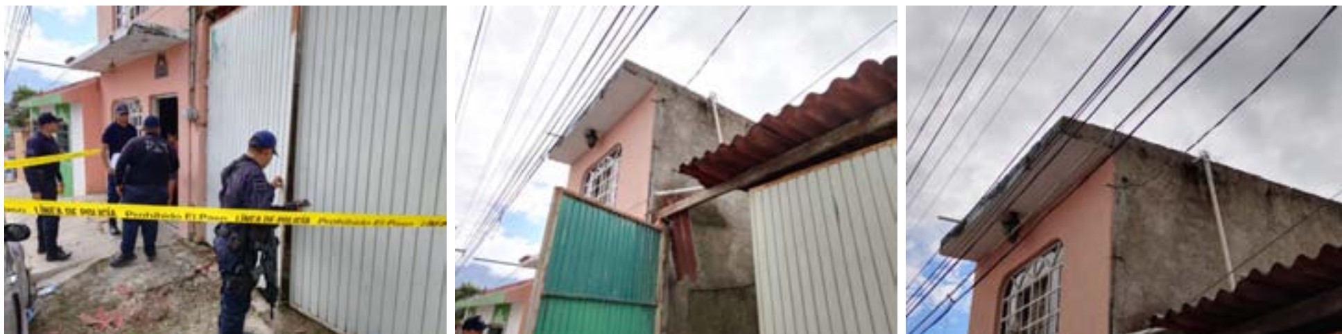
En la colonia Prieto Crispín