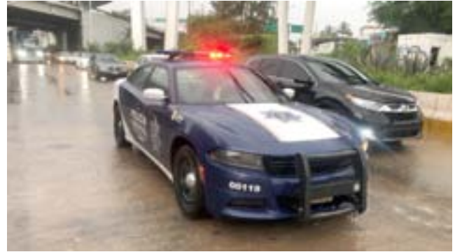
En el libramiento de Tepic