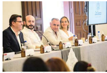
En el marco de la conmemoración del Día Mundial contra la Trata

Para agregar una cita, conocer el calendario mes-placa, capacidad instalada y ubicación de los Centros de Verificación Responsable en operación, se puede ingresar a: verificacionresponsable.jalisco.gob.mx .