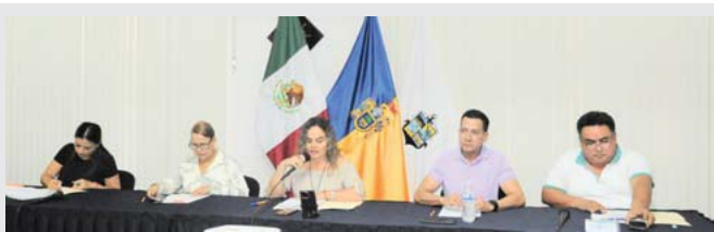
En mercado municipal de Ixtapa