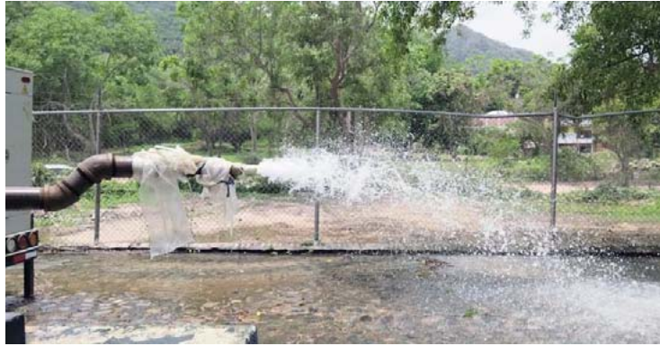
Anuncia SEAPAL, en parte alta de El Pitillal