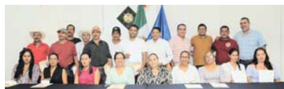
Entregaron constancias a los asistentes del curso básico