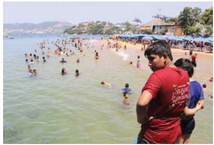
Análisis sanitario de Cofepris en México, negativo

El 14% de las niñas y los niños de 5 a 11 años tienen alto grado de obesidad, y entre los factores que la propician es la sustitución de leche materna en su alimentación.