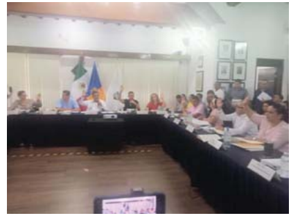
Por el periodo de un mes

Como parte de esta sesión, se turnó a comisiones la iniciativa del presidente municipal de otorgar en donación a la Delegación de Programas para el Bienestar Jalisco un predio de propiedad municipal con superficie de 400 metros cuadrados, ubicado entre la Av. José Guadalupe Zuno, en el fraccionamiento Palmares Universidad de la Delegación de Ixtapa, para ser destinado a la construcción de una sucursal del Banco de Bienestar en nuestro municipio.