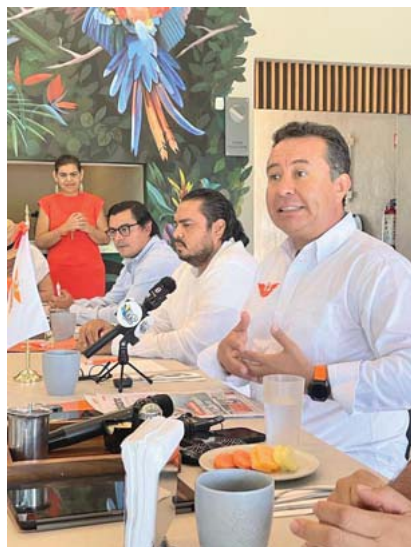
Movimiento Ciudadano hará política permanente al lado de las y los vallartenses

Por otro lado, dijo observan que los servicios públicos de esta ciudad, están en el abandono: alumbrado público, problemas de agua, asfo público, "no hay avance ni prosperidad para la ciudadanía, solo para unos cuantos." Y continuó "estamos en el rol de señalar, de observar las deficiencias y desde luego exigirle a la autoridad y de forma solidaria con los ciudadanos, que cumplan con estos servicios que son tan preciados y sobre todo, el agua que es tan necesaria para todo mundo."