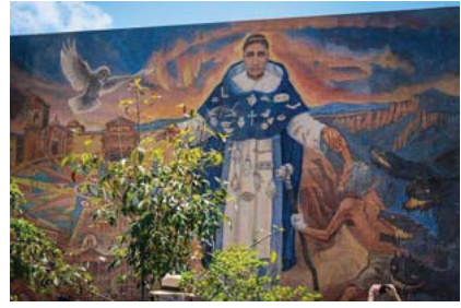
Autoridades develan mural del fraile de la calavera