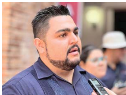
Expone Dirección de Turismo y Desarrollo Económico

"Sabemos que este vital servicio es fundamental para todas las tareas en los hogares e incide en la calidad de vida de todas las personas, por ello, redoblamos esfuerzos para poner fin a la intermitencia en el abasto que afectó principalmente a la zona alta de la delegación El Pitillal, durante el periodo de estiaje".