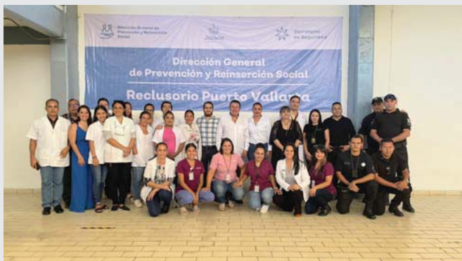
Recibe certificación de la Secretaría de Salud Jalisco