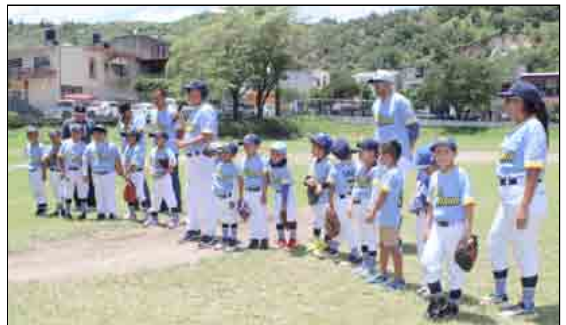
Los dos equipos de la liga Kora, Pre Moyotes y Moyotes que compitieron en Nuevo León y en Oaxaca.