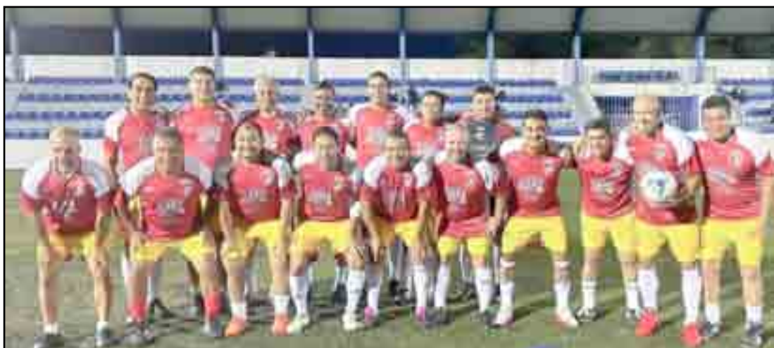
Echarán todo lo que saben los ex profesionales el sábado próximo.