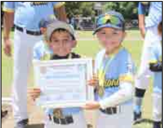
La niña y el niño contentos con el diploma que les entregó la Liga Popular Intermunicipal de Beisbol de Tepic.