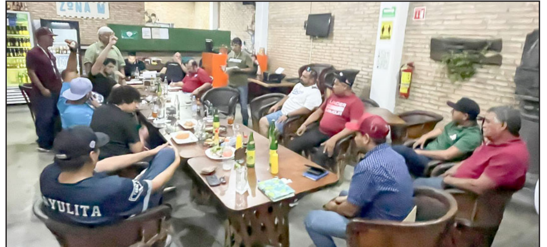
Van definiendo la Temporada 2023-2024 de la LIBN, misma que arrancará el próximo 6 de octubre.