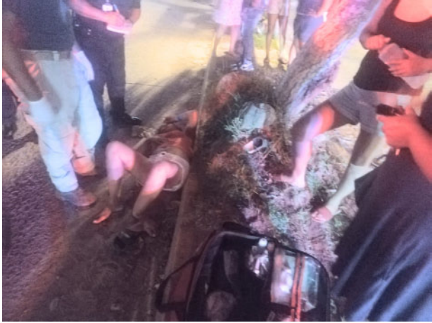
Por Adrián De los Santos y Jesús Calata MERIDIANO/Puerto Vallarta

*Una mujer resultó lesionada de consideración y fue trasladada al Hospital Regional *Presentó una posible fractura en uno de sus tobillos