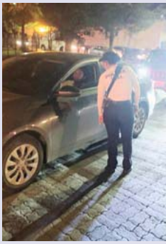
El operativo sigue dando resultados