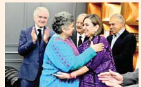
Beatriz Paredes Felicitó a Xóchitl Galvez.