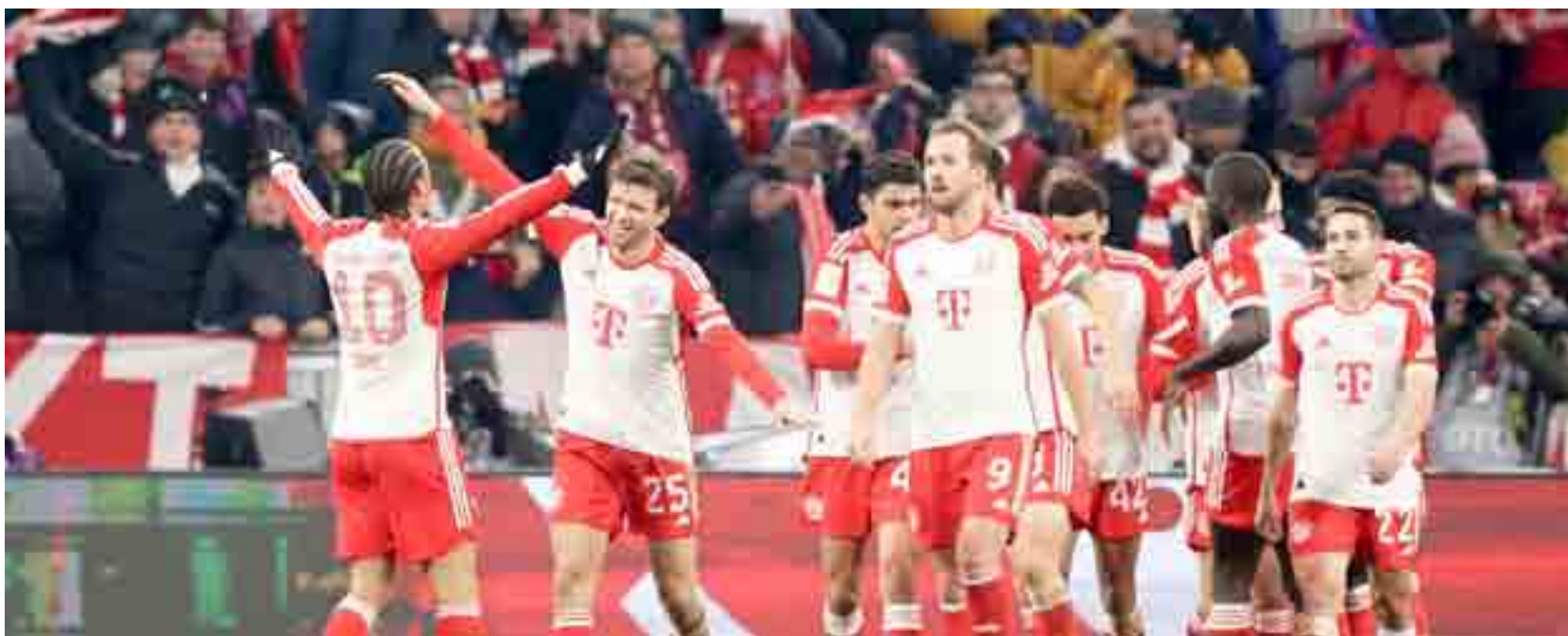
MUNDIAL DE CLUBES