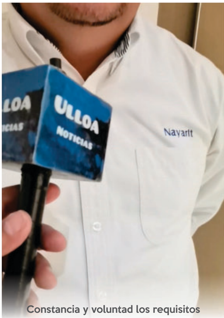
Constancia y voluntad los requisitos