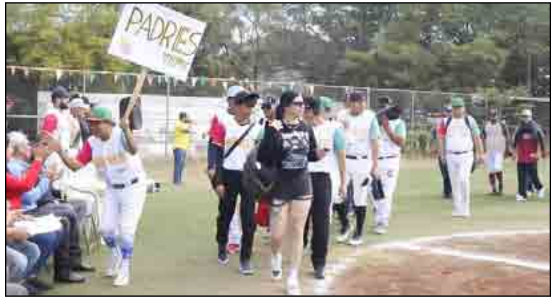
Los Padres de Tepic pasando y saludando a la mesa de presidium en la ceremonia inaugural de la Liga Popular Intermunicipal de Tepic.