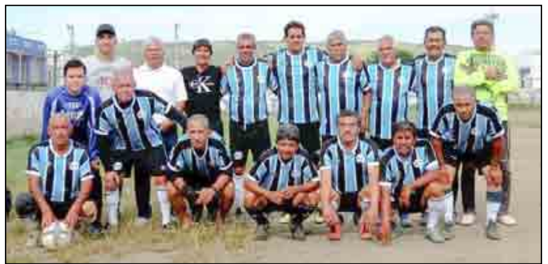
Buen triunfo para Real Provincia ante Chapultepec el anterior domingo.