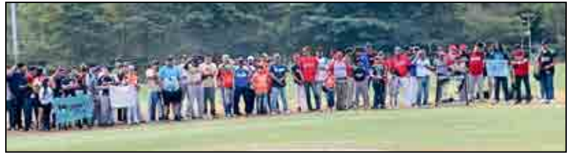
Panorámica de los clubes que acudieron al llamado de la LPIDB