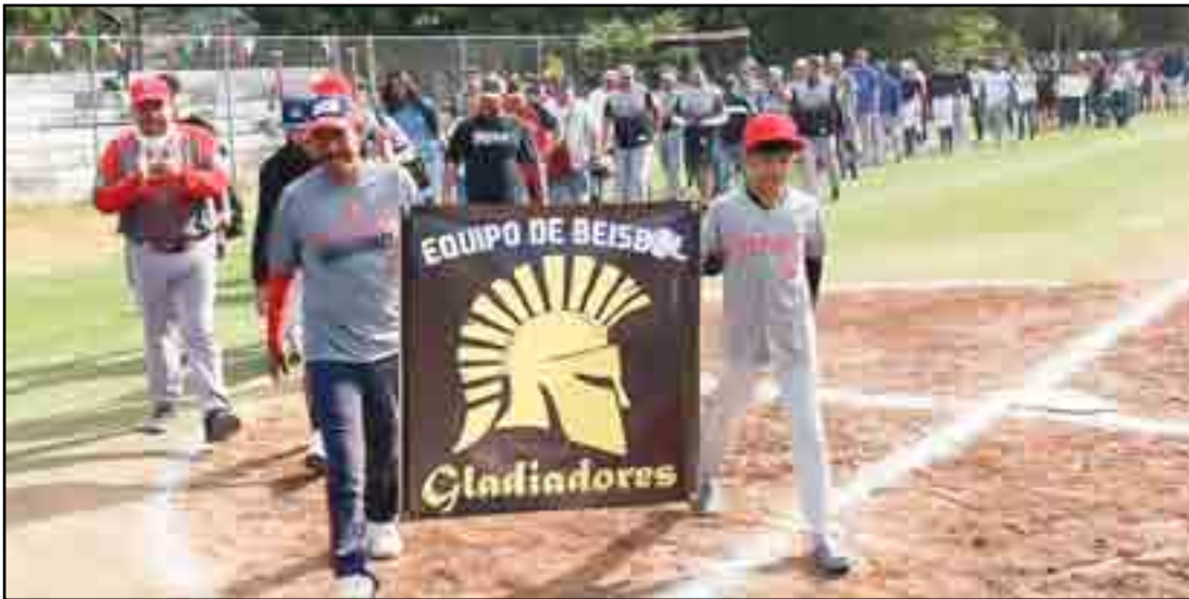
En el desfile los Gladiadores