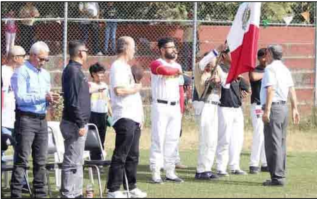
La Liga Popular Intermunicipal de Beisbol de Tepic, con respeto y solemnidad rindió honores a la Bandera de México