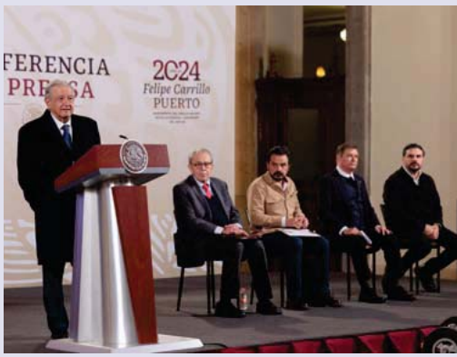
Al menos son 10