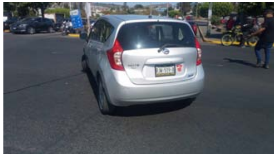
En la avenida Insurgentes