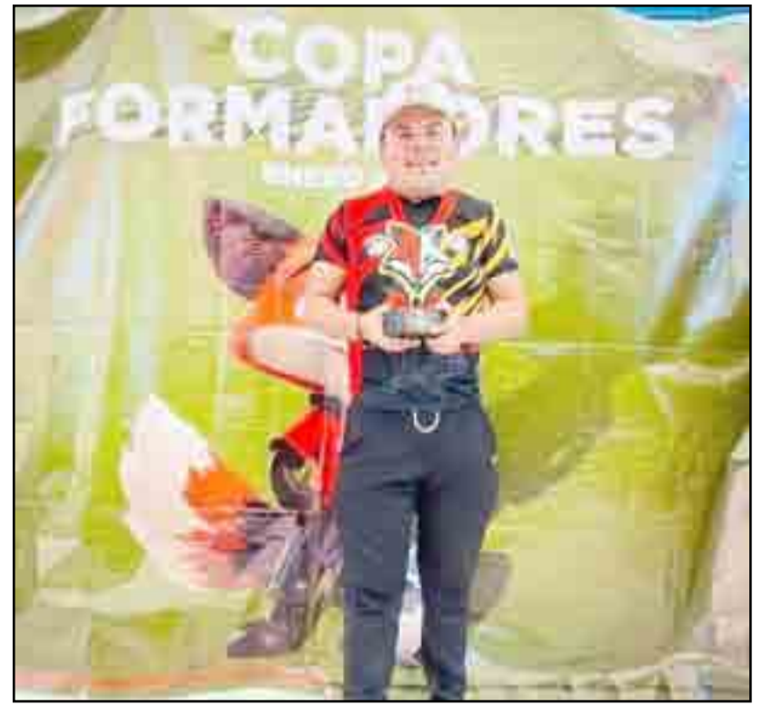
Labor importante la del nutriólogo.

la propuesta de un equipo de Nicaragua en la primera división, aunque estaba contemplado un equipo en Puerto Vallarta en 6 meses más, decidí esperar, ya estando muy cerca el inicio me volvieron a invitar a los coras y acepté, aunque existe el tema del crecimiento, estuve dos años pero se volvieron a llevar la franquicia, son 7 años en esto y me llega la invitación de "Tigres" de Álica de la TDP, es como una academia en la que hay mucho por hacer por el futuro de un niño deportista a tener buenos hábitos de alimentación será más fácil trabajar con él, es mal llamada liga profesional porque no hay paga a los jugadores, quizá un pequeño apoyo y no pueden llevar la dieta indicada, muchos de ellos son estudiantes o tienen un trabajo extra para subsistir, no se puede tener un buen resultado en eso de la nutrición"